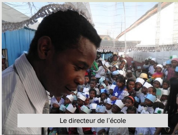
Le directeur de l'école