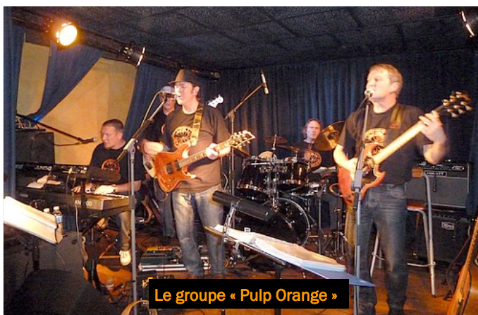
Le groupe « Pulp Orange »