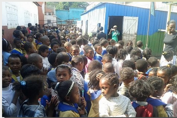
Les enfants dans la cour, au fond en planche, la classe.